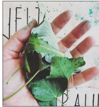
Drucke mit Pflanzen aus dem Garten

Gewerbeverein Reusstal besichtigte wirtschaftlich unabhängiges Mehrfamilienhaus