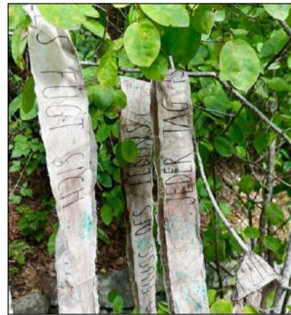
Der Wind blies durch die Bänder.