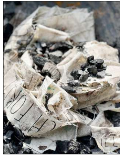
Die Affirmations-Bänder in der Asche